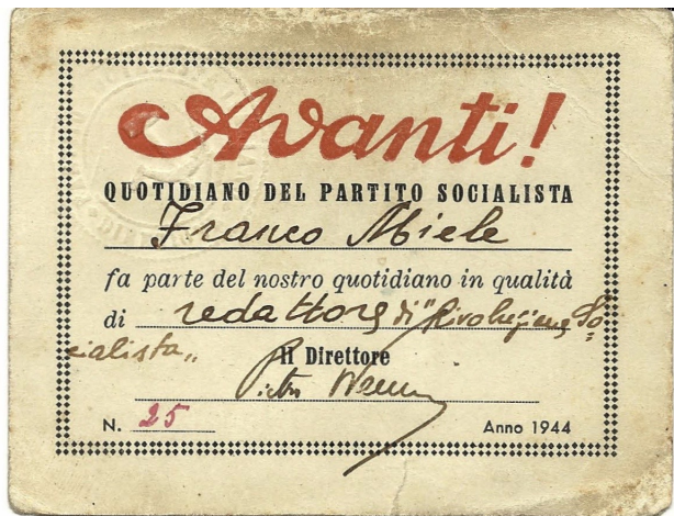
Fig. 3 - Tesserino dell'Avanti!, firmato da Pietro Nenni, attestante la carica di Miele di redattore di Rivoluzione Socialista, 1944.

mostre collettive e pubblicando la sua prima raccolta di poesie, Fuori dal Tempo (1949) 14 . Nel 1952 gli fu affidato l'incarico di critico d'arte del quotidiano "La Giustizia", organo di stampa del PS LI 15 .