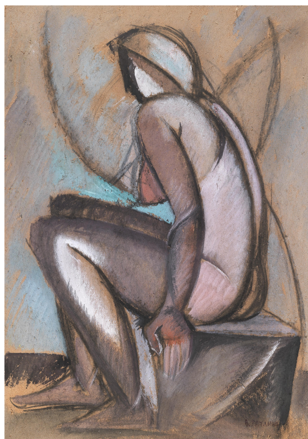
Fig. 12 - Vladimir Tatlin, Nudo di donna seduta , 1913, tempera su cartone, 68,5 x 48 cm, Collezione Andrea ed Elena Miele.