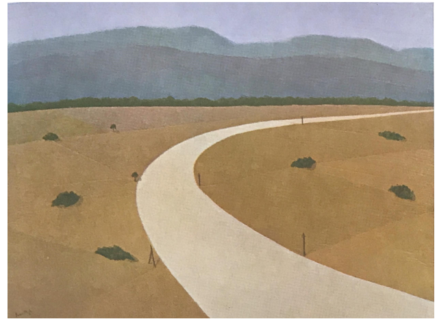
Fig. 15 - Franco Miele, Strada del Sud , 1954-55 ca., olio su tela, 62 x 82 cm.

A quali conclusioni ci conduce lo studio del 'periodo russo' (1965-1972) di Franco Miele? Innanzitutto, che egli, in quanto pittore, docente di figura e critico d'arte e grazie alla vasta rete di conoscenze da lui stesso costruita nel mondo dell'arte moscovita, tra dirigenti di aziende di stato, storici dell'arte, artisti e collezionisti, disponeva di elevati strumenti professionali e di eccezionali opportunità che certamente gli consentivano di condurre l'attività di mercante