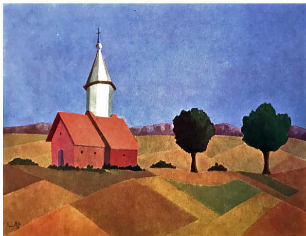
Fig. 10 - Franco Miele, Paesaggio di Karelia , 1966-67 ca., olio su tela, 60 x 80 cm.

espositivi rimasero sulla carta. Tuttavia, questa lettera per noi è molto importante perché ci fa capire che Miele aveva già all'epoca una buona padronanza della storia dell'arte sovietica e che era ben introdotto presso le autorità di Mosca. Inoltre, scopriamo come egli, prima ancora di iniziare nel 1968 a organizzare mostre in proprio di artisti non conformisti (Neizvestnyj, Sitnikov e Beljutin) 61 , avesse cercato di diventare un curatore ufficiale di arte sovietica in Italia.