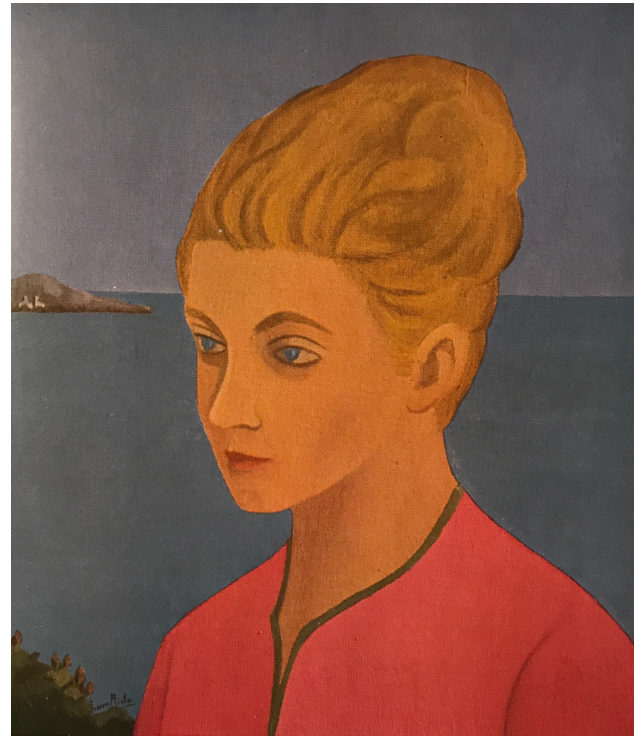
Fig. 9 - Franco Miele, Ricordo di Xenia , 1966-67 ca., olio su tela, 35 x 30 cm.

Finita questa premessa, Miele passò quindi alla descrizione del progetto di “(una grande mostra di pittura sovietica contemporanea (con circa 200 opere e più))” nella quale si sarebbero dovuti esporre “(accanto agli artisti deceduti o ai pittori più che anziani (come Sarian, Deineka) gruppi di giovani o della media generazione, fra i più significativi delle varie repubbliche)” 58 . Propose di organizzarla a Palazzo delle Esposizioni, precisando che lo si sarebbe potuto ottenere gratuitamente dal Comune di Roma, e sottopose un preventivo delle spese che la Rappresentanza Commerciale avrebbe dovuto affrontare per l'organizzazione (allestimento, catalogo, utenze, ecc.). Per quanto riguarda la