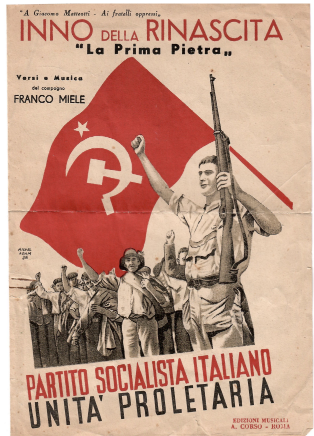
Fig. 4 - Copertina de La Prima Pietra , inno del PSIUP. Versi e musica di Franco Miele, 1944.

Nel 1953 si recò negli Stati Uniti insieme ad alcuni colleghi giornalisti e sindacalisti con un viaggio organizzato dalla Foreign Operations Administration (FOA) 16 . Non è ben chiaro per quanto tempo si fosse fermato oltreoceano e di cosa si fosse occupato nello specifico. Sappiamo solo che, nel corso dell'estate, si occupò, tra l'altro, di avviare "relazio-