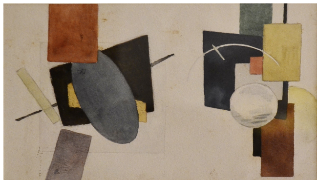
Fig. 13 - Ivan Kljun, Studio di composizione suprematista , 1919 ca., acquerello e grafite su carta, 12 x 21,2 cm, Collezione Andrea ed Elena Miele.